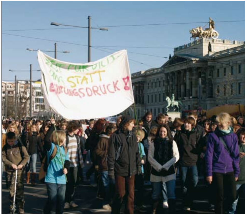
„Wir sind HIER! Wir sind LAUT weil ihr uns die Bildung klagt!“ Unter diesem Motto haben über 8.500 Schüler in Braunschweig demonstriert.

„Das ist vollkommen unausgewogen und wird von der SPD nicht mitgetragen. Die Zukunftschancen unserer Kinder müssen dem Rat und der Stadtverwaltung mindestens genau so wichtig sein wie die Modernisierung des Stadions!“ fordert Pesditschek.