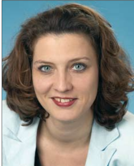
Seit dem Jahr 2000 engagiert sich Dr. Carola Reimann für Braunschweig im Deutschen Bundestag.

Zur Verbesserung der Infrastruktur wurden im aktuellen Haushaltsplan des Bundes über 80 Millionen Euro für den Ausbau der ICE-Strecke Hildesheim-Braunschweig bereitgestellt. Außerdem fließen seit Jahren Mittel in den Ausbau der Autobahn A 39.